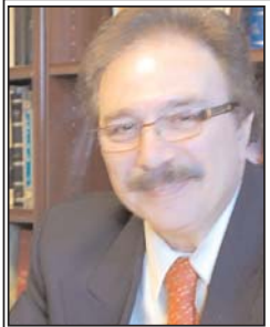
مهدی فرارنجی مشکلات هندسی

فدوی همواره به تحصیلات ابتدائی و متوسطه، و نیز تأثیر تعیین کننده ی برخی مواد درسی، بویژه حساب و هندسه در زندگی فردی و اجتماعی، شدیداً باور و تأکید داشته و لزوم فراگیری آن را، حتی مقدم بر ودکای شنبانه، و عدم توجه به آن را، موجب خطا در تشخیص اتفاقات زمانه، می دانسته است.