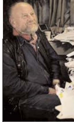
پلیس دانمارک به فردی که وارد منزل کورت وسترگارد کاریکاتوریست کورت وسترگارد شده بود شلیک و او را زخمی کرد.

کورت وسترگارد با انتشار کاریکاتوری از حضرت محمد در یک نشریه دانمارکی در سال ۲۰۰۶ خشم بسیاری از مسلمانان جهان را برانگیخت. به گزارش رسانه های دانمارک او همراه با همسر و نوه اش در منزل خود در شهر آرهوس بود که ناگهان مردی با شکستن شیشه وارد خانه شد و او را با چکش تهدید به قتل کرد. گفته می‌شود وسترگارد بلافاصله با فشار دادن دکمه خطر که مستقیماً به اداره پلیس مرتبط است مأمورین را از این حادثه مطلع کرد. دقایقی بعد نیروهای پلیس وارد منزل شده و به این فرد تیراندازی و او را زخمی کردند.