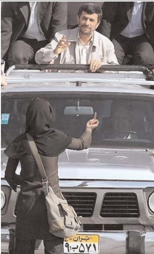
شود و این ملتی که احترام شان روز بروز از دست می رود و زندگی

برایشان دشوارتر می شود و در عوض دروغ پس دروغ است که حقتن می شود به ملت. گفته شده است که در مزایده پیشنهادی یک میلیاردی عرب گفته است ماشین شما را یک میلیارد تومان می خرد و آوخ که چه کاری می کند. یکی از همان میلیاردیهای عرب است که آیت الله خمینی مظهر اسلام آمریکایی اش شناخته بود، یا یکی از آن میلیاردیهای عرب مثل بن لادن است که با انحصار تعمیرات مکه و مدینه هزینه تروریست ها را می دهد، یا یکی است مثل "دودی الفاند" که عشقش این بود که یا ستاره جنجالی روزنامه ها شود و با پرنسس دینا داستان عشق لیلی و مجنون عامری را بازی کند یا مثل پدرش محمد الفاند میخ اش را در فروشگاه هارودز لندن بگوید یا یکی است مثل عدنان غلیب که عاشق بریتنی اسپیرز شده و قرار است او را هم مسلمان کند و لاید که هزار مسلمان اگر دین شان را بخاطر شما از دست بدهند، مهم نیست، ولی بریتنی اسپیرز و مارادونا اگر مسلمان بشوند، چه خواهد شد... این کدام میلیاردی عرب است و پولش از کدام برج نفت صادر شده و اگر قرار است ماشین احمدی نژاد را بپهلوی بریتنی اسپیرز و عکس دینا بگذارد، چرا بخشی از پولش را برای گرسنگان غزه خرج نمی کند. چه