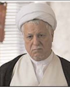
مستقیم علیه اکبر هاشمی رفسنجانی پرداختند.

آیا پروسه حذف رفسنجانی از سوی مقامات دولتی کلید خورده است