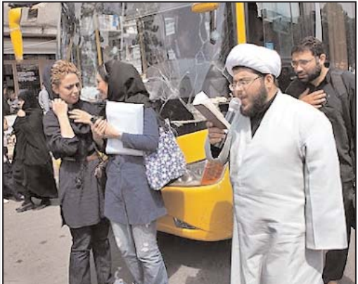
برداشتن تحریم ها بیفتند. اما بانک مرکزی ایران و اقتصاددانان مقامات قرار است همچنان اعلام کنند تحریم ها هیچ تاثیری نداشته است.

وضعیت خود شکایت می کنند. برخی از دولتمردان و روحانیون هم به آنها پیوسته اند و با شهروندان نشان همدردی می کنند و شاید نگران این هستند که این وضعیت ممکن است منجر به شورش اجتماعی بشود. آیت الله محمد یزدی، یک روحانی بلند پایه در نامه ای سرگشاده به محمود احمدی نژاد از قیمت های بالا و اینکه مردم دچار مشکلات فزاینده اقتصادی شده اند، شکایت کرده است.