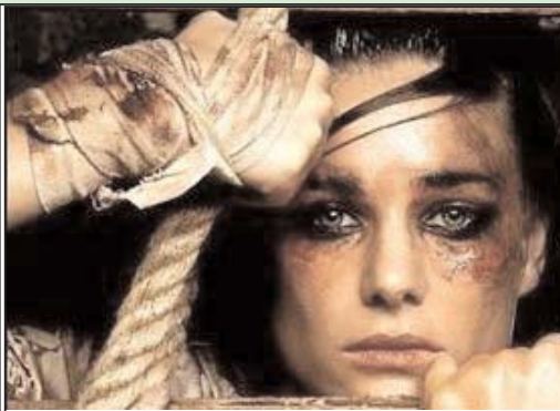
آمار آمریکاییان نشان می دهد که از هر سه دختر یکی و از هر هفت پسر یکی در کودکی مورد تجاوز پدر یا پدر بزرگ قرار می گیرد.

در ایران آمار رسمی نداریم، چون گویا مجازات پدری که به دخترش تجاوز کند مرگ است. در نتیجه مردم هیچ گزارشی از بابت این مسائل به مقامات مسئول نمی دهند.