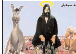
کمپین باذوباری امام تقی به شیعیان

ایران در ماه‌های آینده آماده کند. اردیبهشت، در گزارشی ضمن اشاره به نگرانی مقامات دولت باراک اوباما از مذاکره آنها با دولت اسرائیل درباره مفهوم «ورد شاتول موفاز» و حزب کادیما به یک ائتلاف دولت بنیامین نتانیاهو در ارتباط با جمهوری اسلامی ایران خبر داد. در این گزارش که در وبسایت روزنامه معاریو منتشر شده اشاره شده است که دولت آمریکا نگران است که این هم‌پیمانی جدید در صحنه سیاست اسرائیل، بستر لازم را برای حمله نظامی اسرائیل به