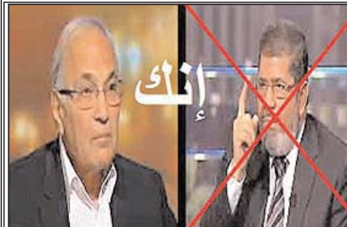
لو عارضت مرسى حقیقی ملحد و کافر و کاره. لو عارضت شفیق حتی بقی مناضل

حال با این شرح مختصر بر تقسیم‌بندی لافور از فضا، می‌توانیم به این موضوع اشاره کنیم که پدیده ماشین بازی برای جوانان در واقع شکلی است از همین خلق‌لحظه‌های در دل شهر یا همان خلق‌فضاهای بازمانی. فضاهایی که با این پر و خوری شدن‌های مدام، گفتمان‌های در دل شهر حک می‌کنند، اما در این میان این موضوع برای زنان معنای مضاعفی هم می‌یابد که باید به آن اشاره شود. این پدیده برای زنان جوان نه تنها شکلی از گذران اوقات فراغت است که در دل خشونت شهر، که هم به شکل مزاحمت‌های خیابانی و هم در سیمای گشته‌های ارشاد خود را نشان می‌دهد، به منزله ایجاد نوعی فضای امن هم هست.