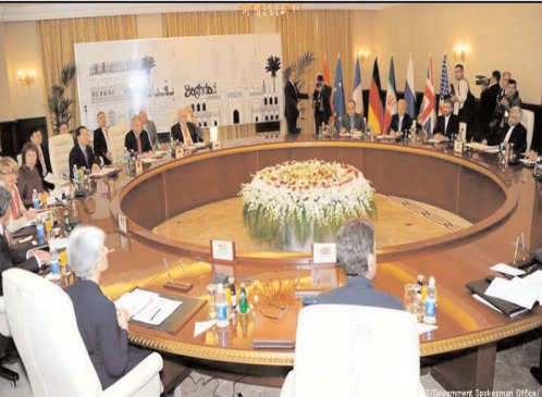
محافظة کاران میانه رو و در رأس آنها علی لاریجانی، رئیس مجلس نیز بی تأثیر نبوده است. علی لاریجانی که به شکلی بی وقفه با محمود احمدی نژاد در کشمکش است، باعث شده تا نفوذ او به شکلی قابل توجهی کاهش یابد. از طرف دیگر، شماری از سران ایرانی چندان هم از تحریم ها ناخوشایند نیستند، زیرا این وضعیت باعث می شود تا آنها بتوانند اصولگرایانه تر برخورد کنند و همواره مقصری به نام غرب را در تیررس خود نگاه دارند. بنابراین اکنون در یک زمان کلیدی بسر می بریم و نباید در جناح غربی ها به گونه ای رفتار شود که این فرصت واقعی برای مذاکره از دست برود. نباید فراموش کرد که برخی گروه ها در ایران [به ویژه گروه های مربوط به انصار حزب الله] معتقدند که نمی توان هیچ انتظاری از مذاکرات داشت. این گروه ها منتظرند تا مذاکرات شکست بخورد و آنها مجدداً در همه امور سرمدار شوند. جمهوری اسلامی می خواهد هرچه سریعتر تحریم ها ملغی اعلام شوند. اتحادیه اروپا در این رابطه می تواند یک نقش تعیین کننده ایفا نماید. همان قدر که مسأله ملغی شدن تحریم های سازمان ملل و آمریکا به تصمیم گیری های سنگین تری منوط می شود، اتحادیه اروپا نیز به راحتی می تواند برخی از این تحریم ها را ملغی کند، به ویژه اینکه چندین بانک به دلیل فشارهای آمریکا از همکاری با ایران سر باز زده اند.

تیری کوویل مذاکرات میان ایران و گروه ۵+۱ در تاریخ ۲۳ مه در بغداد دنبال شد. نشست دیگری نیز برای تاریخ ۱۸ ژوئن ۲۰۱۲ در مسکو در دستور کار است. ولی این بار در جناح غربی ها باید از تکرار اشتباهاتی که در گذشته در چارچوب مذاکرات انجام شده جلوگیری کرد. این بار دیگر نباید مدام تهران را به خرید زمان یا وقت کشی متهم کرد. ممکن است که این طور باشد، ولی چطور می توان مطمئن بود؟ کشورهای غربی با بنا نهادن استراتژی خود بر پایه نیت جمهوری اسلامی، روند مذاکرات را از همان ابتدا به سوی برخی فرضیات [خواست ایران برای دستیابی به بمب اتمی...، هدایت کردند و همین موضوع باعث سخت شدن مواضع جمهوری اسلامی و شکست مذاکرات پیشین گردید. خواست ایران برای انجام مذاکرات اکنون مشخص است. طرفداران اعمال تحریم می گویند که اثر تحریم های اقتصادی باعث بروز این حالت شده. حال آنکه ائتلاف رهبر و