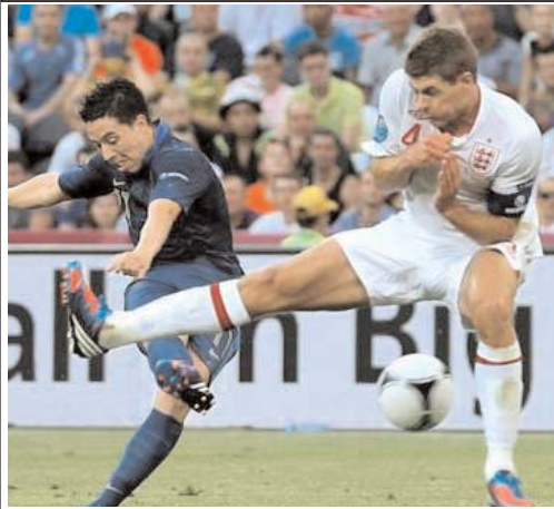
ملی کشورشان را در این مسابقات همراهی نمی کنند.