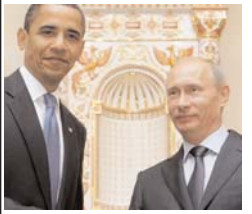
ساعتی پس از پایان روز نخست گفت و گوهای اتمی مسکو، باراک اوباما رئیس جمهوری آمریکا و ولادیمیر پوتین رئیس جمهوری روسیه با صدور بیانیهای مشترک خواستار عمل کردن ایران به تعهدات بین المللی خود شدند. اوباما و پوتین که برای شرکت در کنفرانس گروه ۲۰ مرکزیک به سر می برند در این بیانیه مشترک تصریح کرده اند: ما در این امر از کسانی که در این منطقه ازدواج کردند در کمتر از ۵ سال از یکدیگر جدا شدند.

مجمع فعالان فناوری اطلاعات و رسانه های دیجیتال (فرا) به عنوان "تهادی مردمی (!) در حوزه فناوری"