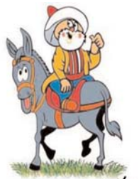
۲۰۰۸ های ملا نصرالدین

گفت: من خروس تو را ندیده ام. ملا دم خروس را دید که از کیسه بیرون زده بود به همین جهت به دزد گفت درست است که تو راست می گویی ولی این دم خروس که از کیسه بیرون آمده است چیز دیگری می گوید.