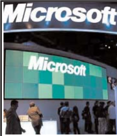
میلیار دلار سود از فروش محصولات خود به دست آورده بود.

کمپانی مایکروسافت برای نخستین بار در ۲۶ سالی که از عرضه رسمی سهام اش در بازار بورس می گذرد، رسماً اعلام ضرر کرد. این در حالی است که سود کمپانی رقیب اش، گوگل، همچنان به سیر صعودی خود ادامه می دهد.