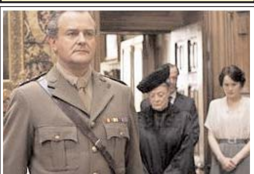
سریال دان تاون ابی در شانزده رشته نامزد جایزه است

سریال درام تلویزیونی "داون تاون ابی" به تهیه کنندگی شبکه تلویزیونی مستقل آی تی وی بریتانیا، نامزد جایزه اصلی امی ۲۰۱۲ شد.