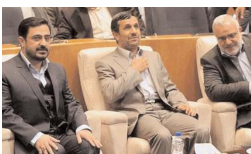
با رای سازمان دیوان عدالت اداری

سال بیستم و چهارم - شماره ۵۶۷۷ سه شنبه دهم مرداد ۱۳۹۱