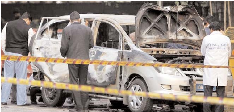
بر اساس گزارش روزنامه تایمز هند و از سوی پلیس هند

حکم انتصاب سعید مرتضوی، متهم جنایت کهریزک باطل شد