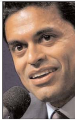
فرید زکریا، از چهره های برجسته دنیای رسانه، به خاطر کپی کاری و سرقت ادبی از مطلبی در مجله

نیویورکر، از سمت های خود در هفته نامه تایم و شبکه سی ان ان تعلیق شده تا بررسی های بیشتر درباره کار او انجام شود. فرید زکریا، از روزنامه نگاران برجسته جهان و از سوپرستاره های دنیای رسانه، روز جمعه (۲۰ مرداد، ۱۰ اوت) به خاطر سرعت ادبی، به مدت یک ماه از ادامه فعالیت در هفته نامه آمریکایی تایم و شبکه تلویزیونی سی ان ان محروم شد. او از سردبیران مجله تایم و مجری برنامه مشهور GPS در شبکه سی ان ان است و حالا کپی کاری از یک پاراگراف مطلبی که پیش تر در مجله نیویورکر منتشر شده بود، او را به دردسر انداخته و به بمبی خبری در سرعت ادبی از مطلبی در مجله جهان رسانه ها تبدیل شده است.