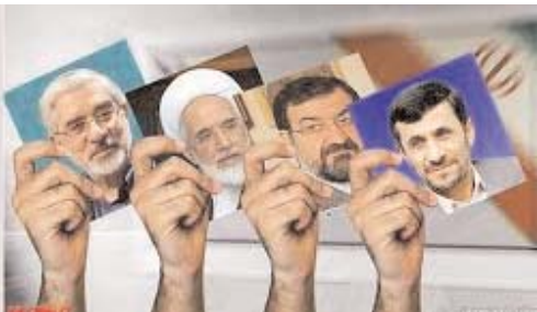
سخنگوی شورای نگهبان:

وزارت کشور مجری انتخابات نیست دولت اگر اعتراضی به حکم مرتضوی دارد قانونی بیان کند