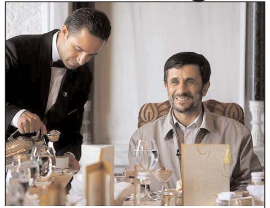
عکس روز: تعیین بفرمانید کدام یک بیشتر برازنده ریاست جمهوری هستند؟