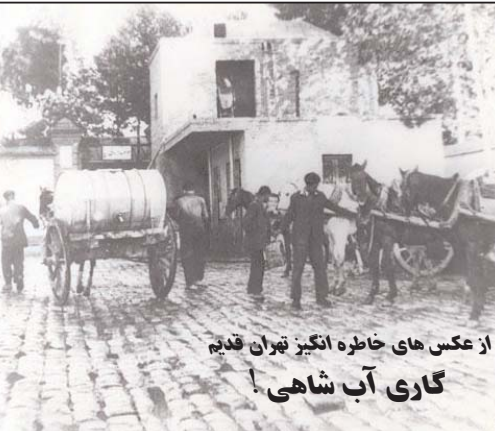
از عکس های خاطره انگیز تهران قدیم گاری آب شاهی!

۱۰- به زنی که ریش دارد از دور سلام کن ۱۱- برای اینکه زندگی زناشویی آرام باشد شوهر باید کر وزن باید کور باشد. به ضرب المثل مفید اسکاتلندی: برای آدم بهانه گیر همیشه بهانه وجود دارد.