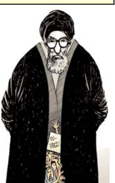
این دو قطعه شعر طنز سالها قبل سروده شده و البته هنوز خواندنی است بیشتر به رفت و آمد در شهر و مشکلات آن پرداخته و از این رهگذر کمی هم به گرانی، این بار همیشه مردم ما اشاره کرده!