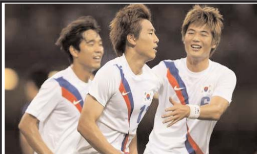
این خبرگزاری در پایان نوشت: بدی که پیدا کرده‌اند باید کره‌ای‌های خرافاتی با ذهنیتی خودشان را از پیش باخته بدانند!