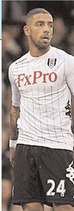
دیلی میل گزارش داد

او شخصیت جالبی دارد؟ بله. این بازیکن در سال ۲۰۰۷ و پس از اینکه حاضر نشد با تیم زیر ۲۱ سال آلمان مقابل تیم اسرائیل بازی کند، محاکمه شد. او متهم به این شد که به دلیل تصمیمات سیاسی از انجام این بازی خودداری کرده است. دلایلی از جمله مسئله یهودستیزی و یا نژادپرستی که او