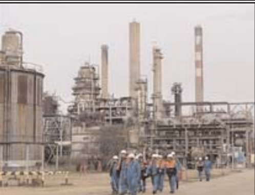
بقیه در صفحه ۴