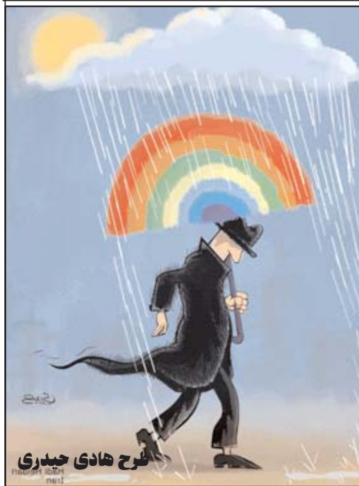
طرح هادی حیدری

وقتی انقلاب شد، یا درست تر بگویم وقتی انقلاب داشت می شد گمانشان بود که زندان ها مدرسه می شوند و شهرها که گورستان شده اند گلستان خواهند شد...اما