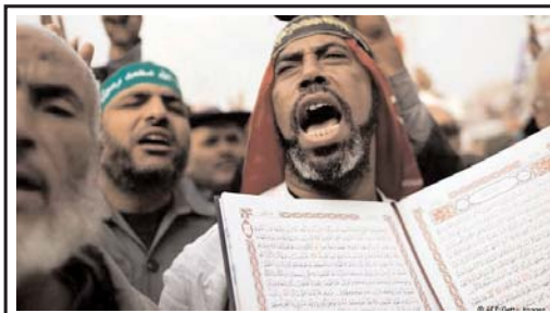
طبق پیش بینی حزب حاکم اخوان المسلمین در مصر

اکثریت مصریها به قانون اساسی جدید رای مثبت داده اند