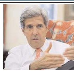
سنای آمریکا روز سه شنبه به جان کری (Kerry)، نامزد پیشنهادی باراک اوباما برای وزارت خارجه، رأی اعتماد داد.

جان کری، که نماینده ایالت ماساچوست در سنای آمریکا است، با ۹۴ رأی موافق در برابر سه رأی مخالف موفق به کسب رأی اعتماد شد. آقای کری، که ۶۹ سال دارد، پس از ادای سوگند، جانشین هیلاری کلینتون خواهد شد. جان کری ۹ سال پیش رقیب جرج بوش در انتخابات ریاست جمهوری بود و در چهار سال گذشته ریاست کمیسیون روابط خارجی سنای آمریکا را برعهده داشته است.