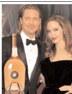
مشهورترین زوج سلبریتی دنیا، تا یک ماه دیگر شراب با مارک مخصوص خودشان روانه بازار می کنند.

این خبر تعجب کنید. آن ها دائم به دنبال این هستند که در همه چیز بهترین باشند. قرار است نام این شراب ros wine Brangelina's باشد. حال باید منتظر باشیم که این شراب جدید چقدر می تواند متضمن شهرت این دو سلبریتی محبوب باشد. در ادامه تصاویری از این دو سلبریتی به همراه تصویر بطری شراب و تاکستان آن ها در جنوب فرانسه را مشاهده می کنید.