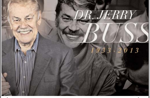
روز گذشته سایت اینترنتی تیم بسکتبال لیکرز خبر داد که دکتر جری باس مالک تیم لیکرز بعد از یک بیماری طولانی و متمد بامداد است

مردم ایران نسبت به روش تغییر وضعیت موجود دیدم می شود از سر باور همین حقیقت است که ضمن تحمل شرایط آسبارموجو، آرام آرام در راهی گام بر میدارد که در آن دیگر چیزی به اسم شور انقلابی مانند ماجرای سال ۵۷ وجود ندارد و هر چه هست درایت است و عقابت اندیشی. خاصه که اکنون علاوه بر معمل سیستم حکومت بی سؤال، خطر چند پارگی وطن وجود دارد و هر روز گروهی بنام استقلال طلبی خوانده جدیدی از پیگرد واحد دیگر کهنه دپار هستند، از طرف دیگر مطالبات اکثریت جامعه به تنگ آمده از ظلم ایران، دیگر نه با استقرار دوباره نظام پادشاهی و نه با حفظ نظام جمهوری دینی، تحقق می یابد و این مهمترین رمز بی اعتنایی ملت نسبت به طرح و برنامه های برخی از اپوزیسیون و فعالان سیاسی است که بنام آزادی و راهی از استبداد حاکم، داوروی تاریخ گذشته را تجویز می کنند. به دیگر سخن به باور این قلم آنچه مردم را به تحمل شرایط سخت امروز و سکوت وا داشته و به ظاهر ظلم پذیر جلوه می دهد، درایتی است که از پس تجربه انقلابی بودن های ویرانگر بدست آمده. و اگر بنا بر انتخاب مشی انقلابی هم باشد قطعاً از نوع مشی خواهد بود و نه از نوع ۵۷ آن.