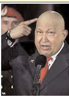
هوگو چاوز، رئیس جمهوری ونزوئلا پس از یک اقامت دو ماهه در کوبا و ادامه درمان بیماری

سرطان، روز دوشنبه به کاراکاس بازگشت. آقای چاوز بازگشتش به ونزوئلا را با پیامی از طریق توئیتر اعلام کرد و گفت قرار است روند درمان بیماری اش را در ونزوئلا ادامه بدهد. هوگو چاوز ماه دسامبر برای چهارمین بار در کوبا مورد عمل جراحی قرار گرفت. جزئیات چندانی از نوع و شدت سرطان آقای چاوز منتشر نشده است جز آنکه بیماری در ناحیه لگن خاصره متمرکز است. نیکلاس مادورو، معاون هوگو چاوز در ماه ژانویه وضعیت رئیس جمهوری ونزوئلا را حساس توصیف کرده بود.