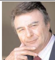
پرویز قاضی سعید

روا (ولو) اندیشمند دیگر فرانسوی دلایل گوناگونی برای این سبزه تازه در جهان عنوان میکند که از بحث امروز ما خارج است. اما در نهایت تمامی مشکلات امروز را از روابط خاص «اعراب» و «اسرائیل» ناشی میداند که شرح آن در این مختصر نمی گنجد. در چهار چوب همین سیاست نوین و تازه و نوپاست که «روحانی» به اصطلاح میانه رو از پس احمدی نژاد مثلا "تندرو" ظهور میکند در حالیکه همگان میدانند تا تیرک سیاست را خامنه ای زیر چادر «ولایت» میکوبد و با آترا جا به جا میکند در مفهوم کلی فرقی برای ایران ندارد مگر اینکه تصور کنیم و باور کنیم، بنا بر سیاست روز، جای این چادر عوض میشود تا بتواند در سایه آن از سوزش آفتاب تناقضات به کاند!