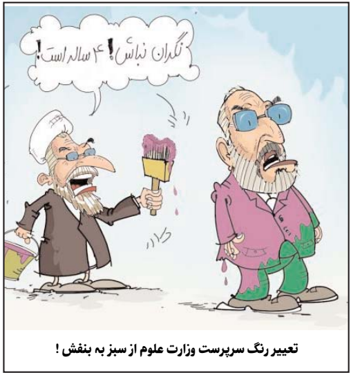
تعبیر رنگ سرپرست وزارت علوم از سبز به بنفش!

وی با گرفتن روایتی به آمریکا رفت ولی اجازه داور در دور مقدماتی این تورنمنت به او داده نشد، زیرا، به نوشته نیویورک تایمز، بر اساس قوانین تحریم های آمریکا علیه ایران، اتحادیه تنیس آمریکا نمی تواند از خدمات افراد