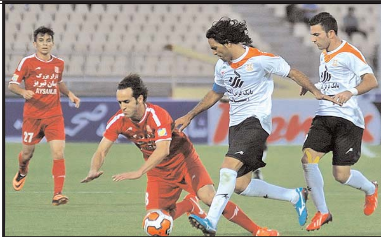
راضی کننده باشد.

هفته ششم با انجام هفت دیدار از امروز پیگیری می شود