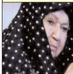
۱. همسر امام