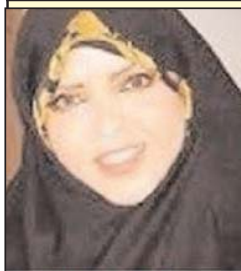
۳. نوه امام