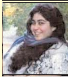
۴. نتیجه امام