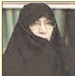
۲. دختر امام