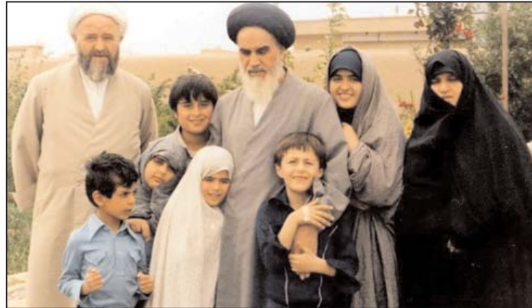
از راست: دکتر مریم السادات خمینی (فرزند مصطفی خمینی)، زهرا اشرافی، سید حسن خمینی، امام خمینی، عاطفه اشرافی، مهندس علی اشرافی، فیهمه و فریدرضا اشرافی (برادرزاده های آیت الله اشرافی)، آیت الله شهاب الدین اشرافی.