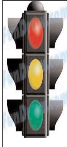
بقیه در صفحه ۴

تجرد و سلامتی جامعه شناسان دانشگاه تگزاس آستین معتقدند که مجردها از سلامت جسمی بهتری برخوردارند و احساس رضایت مندی بیشتری دارند. این مدعا بر نتایج استوار شده که از طرح پرسشنامه سلامتی ملی این دانشگاه با شرکت یک میلیون و دویست هزار نفر به دست آمد. این طرح در فاصله سال های ۱۹۷۲ تا ۲۰۰۳ انجام شد و نتایج آن در سال ۲۰۰۸ انتشار یافت. این پرسشنامه روشن کرد که تفاوت میزان سلامتی مجردها و