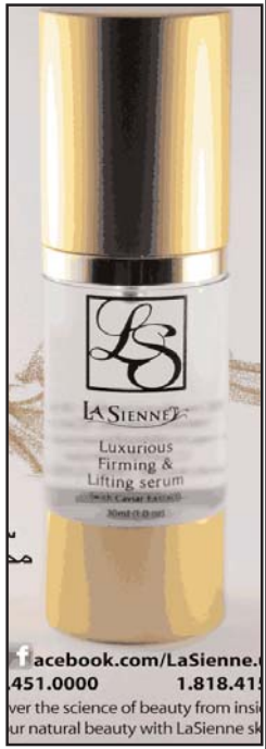
facebook.com/LaSienna. 451.0000 1.818.41. over the science of beauty from insur natural beauty with LaSienna sk

این را که شنید چشمانش را بست و به آرامی نفسی کشید. لحظه ای بعد در حالی که چشمانش حالتی محزون داشت با لحن خواهش گونه و شرمزده ای گفت: می دانم تقصیر از من است، اما حالا جای این حرفها نیست بعد با هم حرف می زنیم. و پیش از آنکه حرف دیگری بزنم فوری به قسمت مردانه مجلس رفت. هم چنان که با نگاه او را تعقیب می کردم از دور چشمم به برادرم عزت خان افتاد. ایستاده بود و از آن فاصله ما را زیر نظر داشت. کمی بعد مجلس شور و حال دیگری به خود گرفت. حالا دیگر مجلس نسبت به ساعتی پیش که غریبه ترها هم حضور داشتند خودمانی تر شده بود. در قسمت مردانه به دستور عموجانم استاد سلمانی که تا آن لحظه او را ندیده بودم از جا بلند شد. بند و بساط کارش را پهن کرد. آن روز عموجانم به حکم ریش سفیدی که در میان اقوام و طایفه داشتند، این استاد سلمانی را با خودشان آورده بودند تا سر و صورت آقایون را بعد از عزا اصلاح کرده و به اصطلاح آنها را با اجازه عموجانم از عزا درآورد. اولین کسی که با اصرار و تعارف عموجانم زیر دست او نشست برادرم عزت خان بود. بعد از برادرم هم نوبت آقایونی بود که حضور داشتند. در این روز جای احمدمیرزا خالی تر از همیشه می نمود. در قسمت خانمها نیز فخرالعاجیه بیکار ننشسته بود. او کلی قواره پارچه های نفیسی که با سلیقه و انتخاب خودش برای خانمها تدارک دیده بود خانمها را به اصطلاح یکی یکی از عزا درآورد.