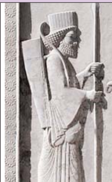
سازمان سرباز ، سرهنگ ستاد - هوشنگ وزین

هزار و چهار صد سال سکوت کافیت ایرانی بیدار شو