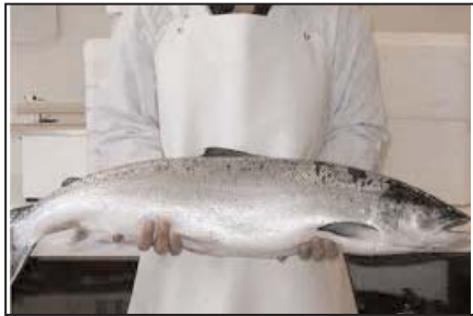
ماهی سمن پاوندی ۵/۹۹ دلار