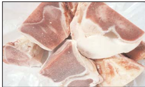
پای گوساله پاوندی ۳/۹۹ دلار