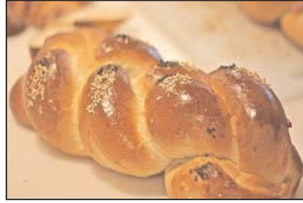
با خرید ۲۵ دلار یک نان مجانی بگیرید