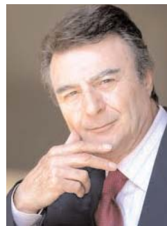
پرویز قاضی سعید

میشوم. دولت های پیروز مانند انگلستان، فرانسه و آمریکا عقیده داشتند که ایران باید بوسیله انگلیس ها اداره شود! در همان زمان جلسات فوق محرمانه آئی هم در تهران ادامه داشت نخست وزیر وقت «وئوتق الدوله» معروف بود که قرار داد ۱۹۱۹ را امضا کرد. همان قرار دادی که ایران رسماً می پذیرفت تحت نظر انگلستان باقی بماند! چرا که پولی در خزانه نداشت! چنان فقیر بود که نمی توانست حقوق اندک سربازان ارتش مسخره خود را بپردازد و انگلستان قبول میکرد که از محل کمپانی هند شرقی کمک هائی به ایران بکند. انگلستان معتقد بود پول دادن بدست رجال و اولیای ایران مانند ریختن آب است در شن زار! و علناً می گفتند که اگر پول بدست رجال ایران برسد بجای اداره کشور به کار توسعه املاک و خانه های مجلل خود می پردازند پس با اینگونه برداشت چه شد که ایران تقسیم نشد اما یک کشور کوچک مانند عراق چون زخمی در پهلو ایران به وجود آمد. انگلیس ها عقیده پیدا کرده بودند که وجود ایران برای تهدید کشورهای تازه به وجود آمده لازم است خاصه اینکه در همسایگی ما، همسایه بزرگ ما روسیه، اتفاقات تازه آئی روی میداد و «بلشویک» ها قدرت روز افزونی می یافتند و انگلیس ها می ترسیدند رقیب قوی آنها روسیه، ایران را یک جا به بعد و سهمی به آن ها نهد! ملاحظه می کنید ما صد سال پیش چه بودیم؟! و آیا تصور نمی کنید که امروز بازگشته ایم به همان صد سال پیش و شاید هم کمی عقب تر؟! آنان که امروز ایران را اداره می کنند بمواظبت خائن تر پول پوست ترو بی ریشه تر از رجال همان صد سال پیش ایران هستند کماینکه می بینم. حکومت اسلامی به آنچه دشمنی ها که عراق از زمان به وجود آمدنش با ایران کرد آنهم به تحریک انگلیس ها باز این روزها دارد وارد باتلاق خطرناک و بی سرنجام