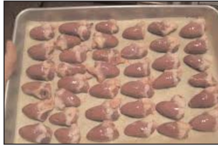
دل و جگر مرغ پاوندی ۶/۹۹ دلار