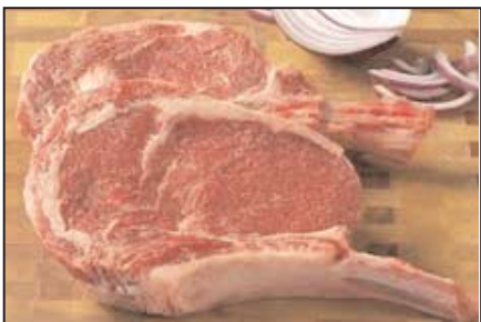
ریب استیک پاوندی ۹/۹۹ دلار