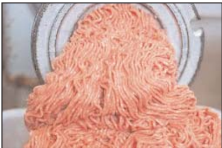
گوشت چرخ کرده پاوندی ۳/۹۹ دلار