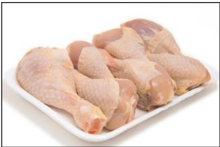
پای مرغ پاوندی ۲/۴۹ دلار