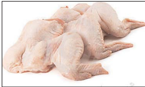
بال مرغ پاوندی ۲/۲۹ دلار