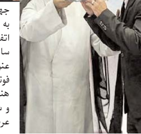
بازیکنان فوتبال گل خوردند، مردم ایران گول خوردند، اما برنده بازی، حکومت اسلامی شد!

وقتی در سال ۸۸ حکومت اسلامی به واسطه سرکوب علنی و برخورد های وحشیانه با مردم، به شدت از اعتبارش بیش از گذشته در جامعه