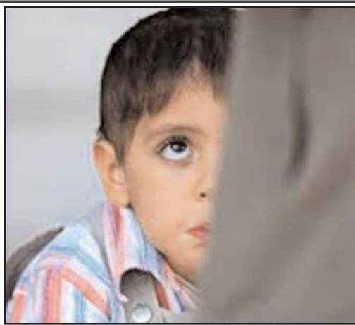
بقیه در صفحه ۴

حیدر عبادی نخست وزیر جدید طبق قانون اساسی عراق یک ماه فرصت دارد تا کابینه خود را معرفی کند و این همان فرصتی است که نوری مالکی مانورهای خود را برای بازگشت به قدرت به عمل خواهد آورد. آنچه اکنون واضح است نوری مالکی براساس قانون اساسی و رأی دادگاه فدرال دیگر نخست وزیر عراق نیست. طبق رأی این دادگاه گروه دارای اکثریت نمایندگان تحت سقف پارلمان حق دارد نخست وزیر جدید عراق را از میان خود معرفی کند. با جدا شدن نمایندگان وفادار به حیدر عبادی و گروه فضیلت محمد یعقوبی از لیست ائتلاف دولت قانون نوری مالکی، و پیوستن گروه حسین شهرستانی به آنها، انشعاب مهمی در داخل حزب مالکی صورت گرفت که سرنواخت نخست وزیر جدید عراق را رقم زد. بر این اساس حدود ۴۵ نفر از نمایندگان ائتلاف قانون به همراه