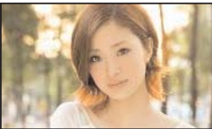
لطفاً انگلیسی صحبت کنید

مصرف نابجای آنتی بیوتیک های سریایی و افزایش شانس مقاومت بدن ناظر ضمن اشاره به اینکه اثر آنتی بیوتیک ها بر جوش های صورت به دلیل ضد التهابی بودن آنها است اما اثر ضد میکروبی آنها خیلی قوی نیست، ادامه داد: آنتی بیوتیک ها به دو دسته تقسیم می شوند. آنتی بیوتیک های سریایی و آنتی بیوتیک هایی که به صورت بستری برای بیماران تجویز می شود و باید آگاه