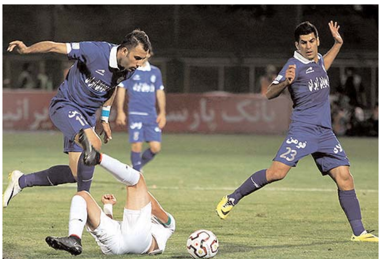
هفته یازدهم لیگ برتر؛

رقابت قعرنشینان و تقابل نفت با یحیی گل محمدی