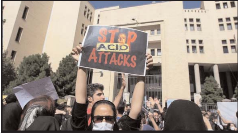
تربیین های نماز جمعه و صدا و سیما در انحصار کسانی است که بزرگترین مشکل جامعه امروز ایران را نه فقر، گرانی، اعتیاد، نابودی محیط زیست که مسئله حجاب زنان می بینند

زن را همسنگ مادر و همسر خوب بودن، اطاعت از مرد و کار نکردن در بیرون از خانه می دانند، به زنان بدحجاب "وعده آتش جهنم و عذاب الهی می دهند و از گناهان بزرگی سخن می گویند که گویا بخاطر بدحجابی دامن جامعه ما را گرفته است. کار به آنجا رسیده که برای نخستین بار زنانی با روپوش حجاب کامل در برابر دوربین قرار می گیرند و نام این رفتارها را هم اسلام واقعی می گذارند. مجلس به عنوان نهاد رسمی با این هجوم سازمان یافته به زنان چگونه برخورد کرده است؟ بیشتر قوانینی که در یک سال پیش در رابطه با زنان تصویب شده اند سمی و