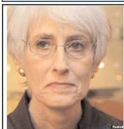
خانم شرمن جایگزین ویلیام برنز، معاون سابق وزارت امور خارجه آمریکا می شود که ماه گذشته بازنشسته شد.

معاون سابق وزارت امور خارجه آمریکا می شود که ماه گذشته بازنشسته شد.