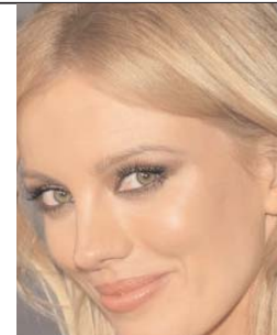
بار پالی یکی از هنرپیشه های

موفق اسرائیلی در عرصه بین المللی به شمار می آید که در فیلم ها و سریال های بسیاری نقش آفریده است. وی امسال در سه فیلم هالیوودی نقش بازی می کند که یکی از آن ها فیلم Urge با پیرس برازنان است که این روزها در حال فیلم برداری می باشد. فیلم دیگری که بار در آن بازی خواهد کرد فیلم Headlock با هنرپیشگی آندی گارسیا است و در فیلم سوم وی در کنار دانیل ردکلیف و ماریسا تومی نقش ایفا خواهد کرد.