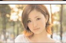
لطفا انگلیسی صحبت کنید

عموجان، خاله جان، دگر نگونیم برای مرگ هم در آرزوئیم یکی حج میروید سالی دو سه بار کنارش خواهرش نادار و ناچار یکی با سود اموال نزولی رود مکه به امید قبول یکی از کربلا و شام گوید یکی از فخر بر اقوام گوید یکی نازد به ماشین و به باغش کی باشد تکبر در دماغش یکی وقتی به ماشینش سوار است فقط مثل بتی از زهرمار است خلاصه وضع تفرقی نداریم همگی بر خر شیطان سواریم