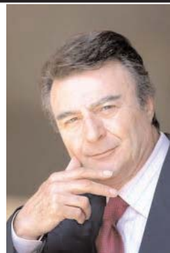
پرویز قاضی سعید

نویسی و نظاره گر بودن ماجراهای سیاسی در داخل و خارج کشور بود. حاصل سی و نیش سال نگریستن روزانه بر آنچه که در حکومت چهل و خون اسلامی میگذرد بود، حاصل مطالعه همه آنچه بود که در طول سالین دراز از زمان انتخابات «فورد» و «گارتن» و سپس جانشینان آنان به وقوع پیوست بود حاصل فقیق شدن در اوضاع و احوال سیاسی جهان و نقشه راهی بود که مدام از آن سخن گفته میشد حاصل زیر و رو کردن و شکافتن مسئله نظم نوین جهانی بود بررسی ژئوپلیتیک منطقه، بررسی جمعیت کشورهای منطقه، میزان تولید ناخالص ملی در کوتاه ترین کلام، بررسی دمل های چرکین بوجود آمده