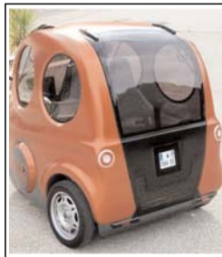
است. قیمت این خودروی عجیب و کم نظیر ۱۰ هزار دلار است.

به گزارش باشگاه خبرنگاران به نقل از لاپلاس، این اتومبیل با هوا کار می کند. البته هوای فشرده، سالم ترین اتومبیل و خودرویی است که تا به حال ساخته شده چون از آگزوز این ماشین هیچ چیز بیرون نمیاید جز همین هوایی که تنفس می کنیم. این اتومبیل توسط شرکت MDI طراحی شده بطوریکه برای سه نفر جا داشته باشد. مانند بازی های کامپیوتری با یک جوی استیک کنترل می شود. این اتومبیل ساخت یک شرکت هندی به نام تاتا موتورز