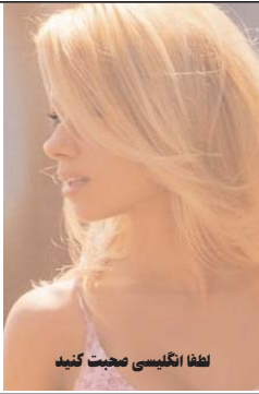
لطفا انگلیسی صحبت کنید

BEAUTY LOLA You stressed and relief? I just the cure all for you 213-369-3220