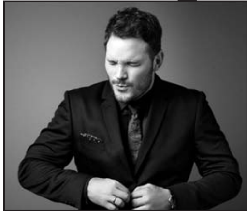
Chris Pratt بازیگر استثنائی هالیوود

تعبیر نکنید، بازاری است مثل بقیه بازارها. با مشتریانی ثابت و پرو پاقرص. با خریدار و فروشنده ای دست به نقد و البته گاه هم دلالان و واسطه گرانی که نان، به نرخ روز می خورند و کارشان در این بجهوه این است که معامله را جوش دهند و پولی عایدشان