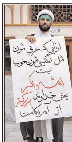
از کشفیات یک آخوند اوانی که عربی شون خوب نیست اله اکبر یعنی خداوند بزرگتر از آمریکاست

سازمان عفو بین الملل در ماه ژوئیه سال جاری اعلام کرده بود نسبت به احتمال شکنجه متهمان نگرانی جدی دارد و خواهان محاکمه عادلانه آن ها شده بود.