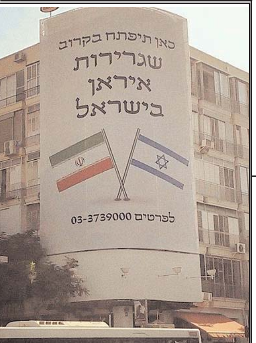
تصویری که دیروز در رسانه های اجتماعی اسرائیل غوغا به پا کرده است. در این بئر که در یکی از خیابان های اورشلیم نصب گردیده نوشته شده: «به زودی در این مکان سفارت ایران در اسرائیل افتتاح خواهد شد»