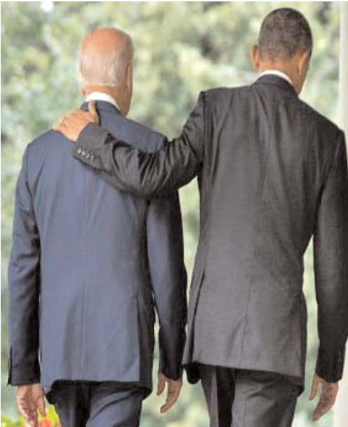
دیداری کوتاه با الیزابت وارن منزل چهره های قدرتمند لیبرال خود را در ایالت دلور ترک کرده و به واشنگتن آمد. الیزابت یکی از

کاخ سفید به "هیولای کلینتون" به چشم مطرح ترین کاندیدای دموکرات ها در انتخابات ریاست جمهوری پیش رو نگاه می کرد اما حال این زرمه شنیده می شود که مبادا وی بهترین گزینه ممکن نباشد.