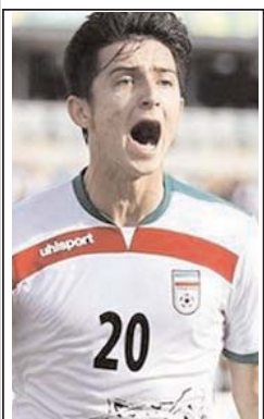
سردار آزمون بهترین بازیکن دیدار ایران و گوام شد

با این برد تیم کشورمان جمع امتیازات خود را در گروه D به عدد ۴ رساند. تیم ایران روز سه شنبه هفته آینده در زمین هند سومین دیدار خود را برگزار خواهد کرد.