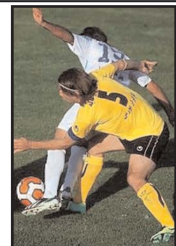
تیم فوتبال سپاهان با توقف در زمین ملوان انزلی شانس صعود به صدر جدول رده بندی را از دست

دا. به گزارش سرویس ورزشی عصر امروز، تیم‌های فوتبال ملوان بندرانزلی و سپاهان اصفهان عصر امروز سه شنبه در چارچوب هفته نهم رقابت‌های لیگ برتر در ورزشگاه تختی انزلی به مصاف یکدیگر رفتند که این بازی در پایان با تساوی بدون گل خاتمه یافت. سپاهان با این تساوی ۲ امتیاز دیگر را از دست داد و نتوانست به صدر جدول رده بندی صعود کند. زردپوشان اصفهانی با ۱۶ امتیاز همچنان در رده دوم جدول باقی ماندند. تیم ملوان هم ۱۳ امتیازی شد.