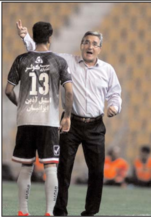
ارزاترین مربی لیگ برتر هفتم / سرمربی تیم فوتبال پرسپولیس که از انتشار مبلغ قراردادش توسط سازمان لیگ دلخور و ناراحت است

با بیان اینکه حتی همسرش هم نمی داند رقم این قرارداد چقدر است گفت: من ارزاترین مربی لیگ هستم. به گزارش خبرنگار مهر، برانکو ایوانکوویچ عصر پنجشنبه و پس از تمرین تیمش به تشریح آخرین وضعیت سرخپوشان برای دیدار دوم برابر فولاد پرداخت و گفت: در بازی دوم باید به مصاف فولاد برویم که مثل شیر زخمی است. آنها در بازی اول شکست خورده اند و چیزی برای از دست دادن ندارند. وی ادامه داد: ما اگر نتوانیم در دیدار دوم برابر فولاد به برتری برسیم برد اول برابر سایپا هم بی اهمیت می شود. بنابراین باید با تمام توان و تمرکز به مصاف این تیم برویم. برانکو در ادامه تأکیدش بر اهمیت دیدار با فولاد خاطرنشان کرد: به خاطر اینکه همه این مسائل را می دانیم فولاد را دست کم نخواهیم گرفت. برای ما مهم نیست که آنها در دیدار برابر ماشین سازی چه فرصت هایی را از دست دادند یا اینکه نتوانستند در دقیق پایانی پنالتی شان را به گل تبدیل کنند. وی افزود: این را می دانیم که یک