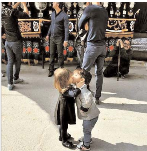
عاشقانه ترین تصویر از روزهای سوگواری امسال در تهران

جیمز کلپر، مدیر اطلاعات ملی آمریکا، در آستانه انتقال قدرت به دونالد ترامپ، رئیس جمهوری منتخب ایالات متحده، استعفا ی خود را از این مقام اعلام کرد. وی هماهنگ کننده ۱۷ سازمان اطلاعاتی آمریکا و از جمله سیا و ان اس ای بود. جیمز کلپر در کنگره آمریکا تصریح کرده بود پس از بیستم ژانویه که قدرت به دونالد ترامپ می رسد در سمت خود باقی نخواهد ماند. این ژنرال ۷۵ ساله روز پنجشنبه ۲۷ آبان ماه به کمیته اطلاعاتی مجلس نمایندگان اعلام کرد که استعفاءنامه خود را دیشب تقدیم کرده است. به گزارش خبرگزاری فرانسه، آقای کلپر گفت که ۶۴ روز از دوران خدمتش باقی مانده که به تعبیر او روزهای سختی برای او و همسرش خواهد بود. دوران مدیریت او مقارن شد با افزایش اسناد آژانس امنیت ملی ایالات متحده آمریکا از سوی ادوارد اسنودن. اسنادی که نشان می دهد این آژانس انبوهی از اطلاعات و مکالمات شهروندان آمریکایی را ثبت و ضبط می کند. این اسناد همچنین نشان می داد که ان اس ای، متحدان آمریکا را هم شنود می کند که به تنش آمریکا با آلمان و فرانسه منجر شد. جیمز کلپر در سال ۲۰۱۳ و پیش از افزایش اسناد توسط اسنودن، در برابر کنگره آمریکا شهادت داده بود که ان اس ای اطلاعات شهروندان آمریکایی را از شرکت های مخابراتی و اینترنتی جمع آوری نمی کند. پس از آن ادوارد اسنودن در مصاحبه ای گفت به خاطر دروغ گوئی جیمز کلپر، این اسناد فوق محرمانه را منتشر کرده است.