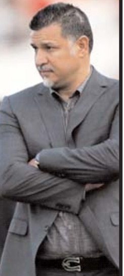
علی دایی باز هم از پرسپولیس شکایت کرد تا به مطالبات خود برسد. اتفاقی که چندان هواداران