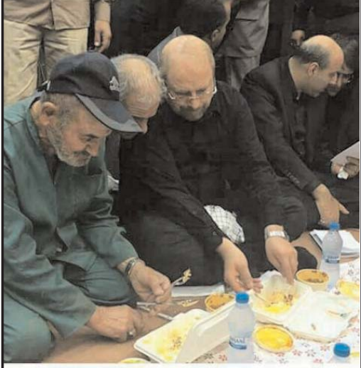
شهردار تهران ندی را با مستمندان میخورد و زمین را با رفقا