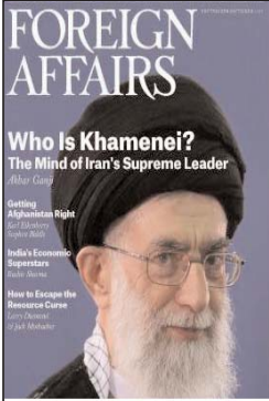
Who is Khamenei? The Mind of Iran's Supreme Leader

تحول دیدگاه های رهبر از جوانی تا کنون و ریشه های آن تقییب شده است. در واقع آمریکایی ها با خواندن این مقاله در می یابند که خامنه ای چگونه درباره آنها فکر می کند و سیاست هایشان را چگونه ارزیابی می کند.