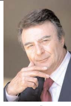
پرویز قاضی سعید

کلام رفتاری متفاوت. اما در عمق، قضایا هیچ تغییری نکرد. فقط فرهنگ کلمات و حرف ها و سخن ها تغییر کرد در حالیکه در معنا یکی است! (روحانی) به اصلاح رئیس جمهور جدید، همان حرف احمدی نژاد را در قالب کلمات و جملات دیگری تکرار میکند و میگوید «تحریم ها، سلاح زنگ زده آئی است که دیگر کاربرد ندارد! آیا معنی این سخن با سخنی که احمدی نژاد میگفت تفاوتی دارد؟! یکی تحریم ها را «گذاضاره می خوانند» و این یکی آنرا «سلاح زنگ زده» می نامد. چون دقت کنید، منطق کور رهبر را هر کدام به نوعی کلام بدون معنا ارائه میدهند و تنها چیزی که برایشان مطرح نیست ملت است. مدالیه که برای قشر حاکم از رهبر گرفته تا دولتی که بدرستی محمد خاتمی گفت «فقط نقش یک کاربردار» را دارد تحریم ها، مطرح نیست عولفه آنها، در حد و اندازه تمام ثروتمندان جهان - کمی هم بیشتر، تا مین میشود. این فقط ملت بخت برگشته و به دام سیاه بدترین و خطرناک ترین عجزه دنیا گرفتار آمده، یعنی خرافه دین و مذهب است که «هم چوب را می خورد و هم پیاز» را! گرسنگی میکشد و اشک می ریزد و راه به جایی نمی برد.