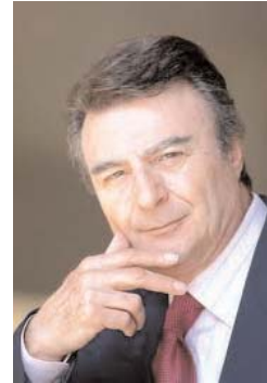
پرویز قاضی سعید

انتظار داشت به پدیده حکومت اسلامی، به چشم یک تحقیق تاریخی، فلسفی بنگرند که کار، کاری است سترک و پیچیده، معیاد با اندکی حوصله و دقت میوان آنرا دریافت. تلاش می کنم، در این مقطع حساس سیاسی که می تواند مسیر تاریخ جهان را عوض کند و سرنوشت یک کشور و ملتی که ده هزار سال تاریخ نظری و حداقل سه هزار سال تاریخ مدون و کتبی دارد، اندکی فقط اندکی به اندازه ممکن مقدور روشن سازیم. طبقه ای که ما به نام کلی «معمم» می شناسیم و این واژه «معمم» در طول پانصد و ششصد سال گذشته به طبقه روحانیت ارتقا یافته است از دیر زمان با قدرت شریک و سهیم بوده است. اندک دقتی نشان میدهد که از دیر زمان این طبقه بنام دین و مذهب سایه دائم حضور قدرت در مرکز تشکیلات سیاسی بسیاری از کشورها و خاصه ایران بوده است. اما آیا این شریک سیاسی و حکومتی، هیچ تجربه، تحصیل و حداقل مطالعه در امر «قدرت سیاسی» داشته است و یا خیر این شریک قدرت در چهار چوب تحقیق مردم و در نتیجه بهره برداری از عامل قدرت به کار رفته است؟! نکته ای که به ظاهر در بادی بقیه در صفحه ۴