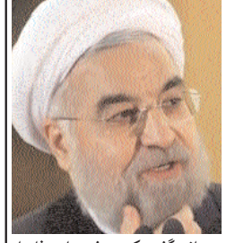
حسن روحانی، رئیس‌جمهور ایران گفته است: وقتی می‌خواهید تولید کنید، یک دستگاه فاسدی که نمی‌خواهید نام ببرم که چگونه می‌تواند کلاه قاچاق وارد کند، نمی‌گذارد کشور رشد کند. باید جلوی این فسادها را بگیریم.

میرحسین موسوی وزیر بهداشت گفت: ما باید به مردم اطلاع‌رسانی کنیم که در این انتخابات چه می‌تواند رخ دهد. ما باید به مردم اطلاع‌رسانی کنیم که در این انتخابات چه می‌تواند رخ دهد.